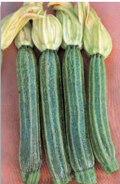
5522 Zucchini Arte F.1

La più popolare varietà di zucchini a pianta contenuta, eretta, con fogliame coprente. Presenta frutti lunghi 18-20cm di colore verde medio. Per coltivazioni in serra e pieno campo. Media precocità.