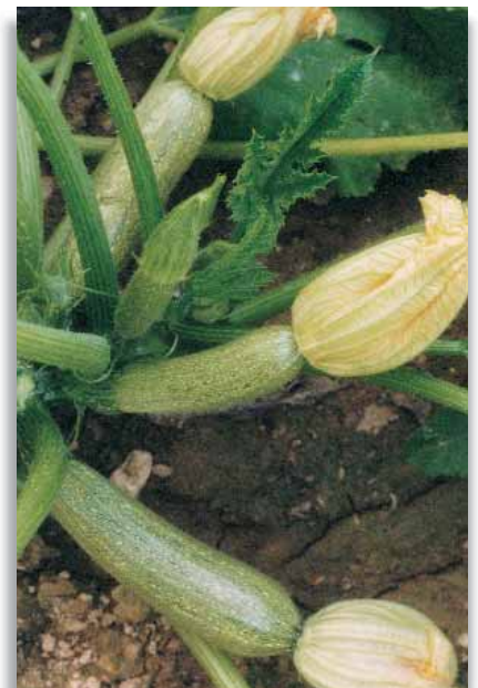
5620 Zucchini Greyzini F.1

Ibrido precoce molto produttivo, tanto da consentire uno stacco al giorno. La pianta, vigorosa, eretta e aperta, produce frutti cilindrici a superficie liscia, lunghi 18-20cm, di colore verde scuro brillante e con cicatrice stilare molto piccola. Ottima tenuta del fiore anche dopo la raccolta. Adatta per colture in serra, dà il meglio in colture a campo aperto.