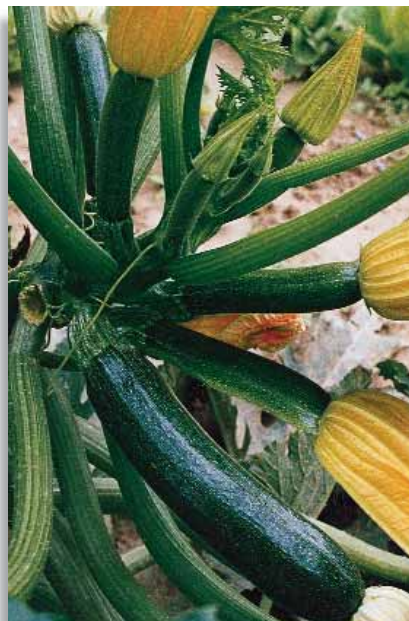
5614 Zucchini Every F.1

Varietà a frutto cilindrico, costoluto, con mazzature verde chiaro-verde scuro, lungo 18-21cm, derivato da un incrocio Fiorentino x Romanesco. Il fiore è grande e ben attaccato al frutto. Per colture in serra e pieno campo.