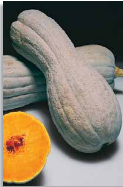
5830 Zucca Butternut

Zucca che soddisfa le esigenze dei produttori che necessitano di un frutto dalle dimensioni veramente notevoli.