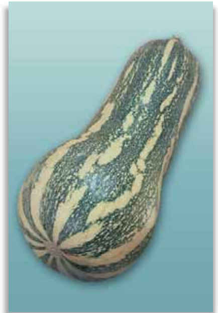
5840 Zucca Barbara F.1

Zucca tipica dalla forma allungata ed allargata all'apice, dal colore giallastro e dall'ottimo sapore. Molto apprezzata in cucina.