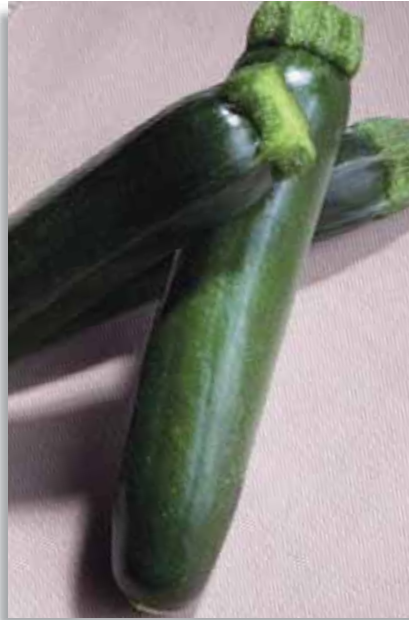
5518 Zucchini Candela F.1

Ibrido precoce di buon vigore, a portamento aperto. Produce frutti lunghi e cilindrici, di colore verde-grigio con leggere striature scure. IR: CMV; ZYMV; WMV; PRSV; Oidio.