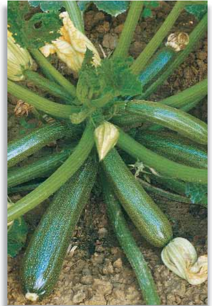
5610 Zucchini Diamant F.1

Varietà a taglia ridotta e portamento eretto, molto precoce. Produce zucchini cilindrici di colore verde medio mazzato, lunghi 18-20cm. Adatta alla coltivazione in serra e pieno campo.