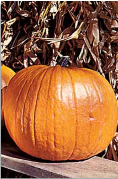
5770 Zucca Gran Gigante

Zucca che soddisfa le esigenze dei produttori che necessitano di un frutto dalle dimensioni veramente notevoli.