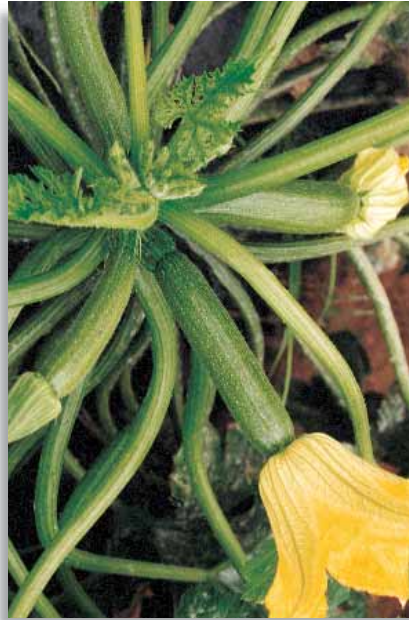
5560 Zucchini President F.1

Pianta contenuta ad internodi corti e portamento unicaule, con fogliame frastagliato e chiazzato di bianco. Presenta frutti cilindrici di colore molto chiaro di 20-22cm, simile alla varietà Genovese. Il fiore è persistente e ben attaccato al frutto. Per coltura in serra e pieno campo.