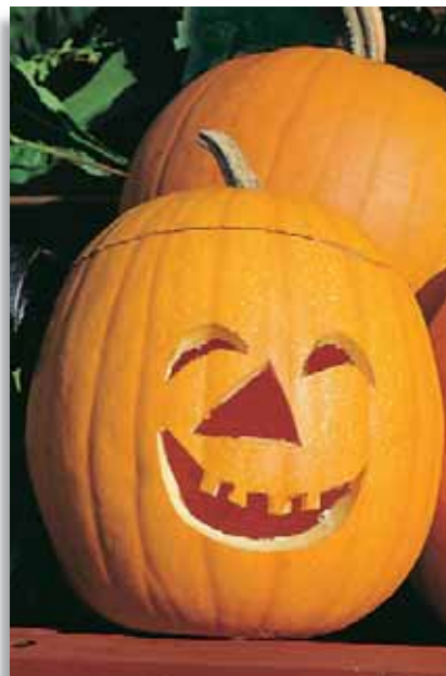
5822 Zucca Halloween

Varietà invernale di colore grigio, a polpa arancione brillante, di peso intorno ai 3-4kg. Buona conservabilità per le vendite invernali.