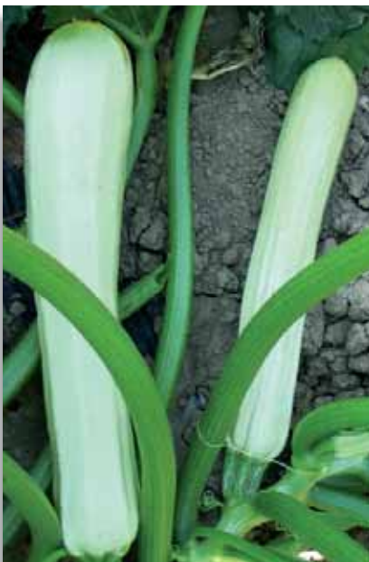
5665 Zucchini bianco di Sicilia

Particolare varietà di zucchini a frutto tondo di colore verde chiaro. La pianta è ad alberello e produce un buon numero di frutti.