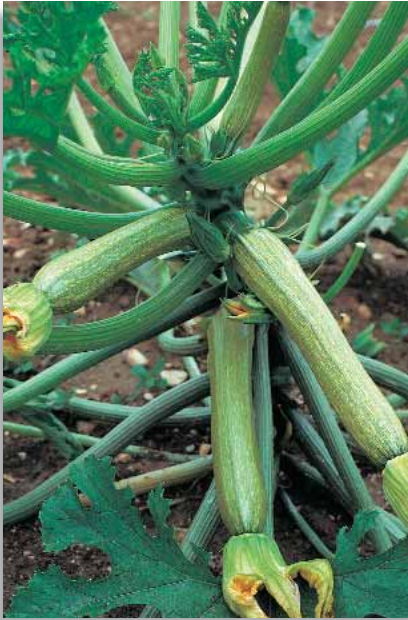
5520 Zucchini Gabbiano F.1

Pianta contenuta ad internodi corti e portamento unicaule, con fogliame frastagliato e chiazzato di bianco. Presenta frutti cilindrici di colore molto chiaro di 20-22cm, simile alla varietà Genovese. Il fiore è persistente e ben attaccato al frutto. Per coltura in serra e pieno campo.