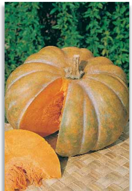
5821 Zucca Moscata di Provenza

Pianta molto vigorosa e produttiva. I frutti, di media grandezza e di ottima consistenza, si mantengono molto a lungo dopo la raccolta.