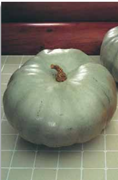
5845 Zucca Crown Prince F.1

Pianta a portamento cespuglioso con ciclo medio precoce. Presenta buccia verde scuro con strisce di color crema e polpa di colore arancione intenso. Il frutto, resistente ai trasporti di lunga distanza, è di forma bulbosa e di peso medio compreso tra 0,8 e 1,2kg. Frutto di forma bulbosa e di peso medio tra 0,8 e 1,2kg. La sua polpa consistente mantiene un'ottima struttura anche dopo la cottura.