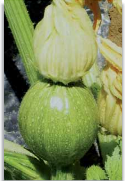
5690 Zucchini tondo chiaro di Toscana

Pianta a ciclo tardivo, di ottimo vigore, dal portamento aperto con internodi corti per una raccolta facilitata. I frutti, cilindrici e molto lucidi, sono di colore verde scuro. Adatto sia per coltivazioni di pieno campo che per le produzioni invernali sotto serra. Elevata serbevolezza. IR: ZYMV; WMV.