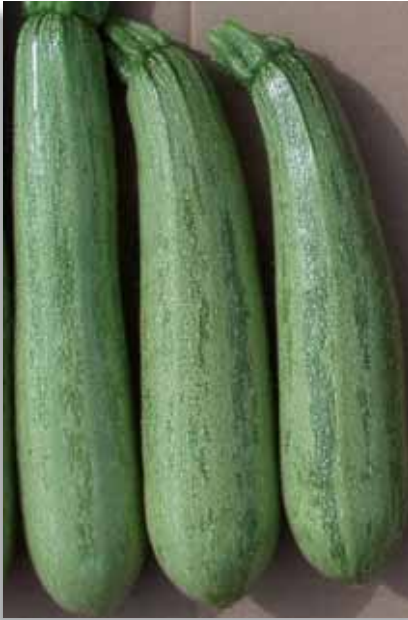
5517 Zucchini Eureka F.1

Ibrido precoce di buon vigore, a portamento aperto. Produce frutti lunghi e cilindrici, di colore verde-grigio con leggere striature scure. IR: CMV; ZYMV; WMV; PRSV; Oidio.