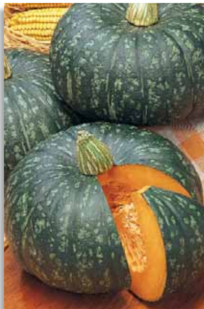
5835 Zucca Delica F.1

Tipico zucchini di colore bianco crema. Il frutto raggiunge e supera la lunghezza di 25-30 cm. Ottimo da friggere. Molto apprezzato in Sicilia.