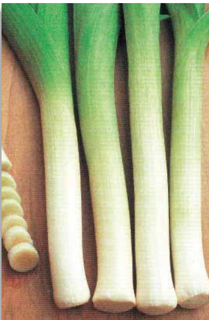
4695 Porro Lungo della Riviera

Pomodoro dal sapore "antico", viene coltivato sia per il consumo fresco che per fare salse e sughi. Rustico e resistente alla siccità. La pianta, molto produttiva, è determinata e viene coltivata a terra, senza sostegno. Frutto di forma appiattita del peso medio di 50-60g.