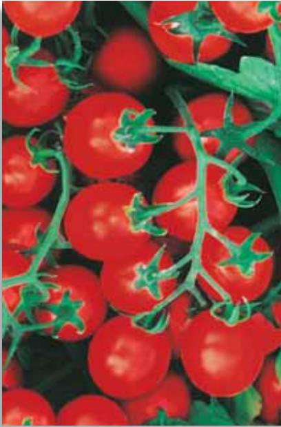
4636 Pomodoro Ciliegino Nano Pallini F.1

Ibrido della tipologia Cherry con pianta determinata, molto compatta, vigorosa e sana, con internodi corti e con ottima copertura fogliare. A ciclo medio-precoce, presenta frutti tondi di piccole dimensioni (15g) a maturazione concentrata. Eccellente tenuta in campo e tollerante alle spaccature, adatto alla raccolta meccanica o manuale, anche a grappolo per il mercato fresco. IR:Tracheovorticilliosi; Tracheofusariosi.