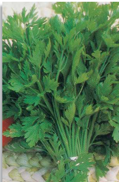
4700 Prezzemolo Comune 2 (Multiseed)

Varietà a fogliame molto lungo di colore verde scuro intenso; fusto eretto senza ingrossamenti alla base. Per raccolte autunnali al nord, autunno-invernali al centro-sud. Per ottenere una maggiore tenerezza della parte bianca si consiglia l'interramento del fusto a maturazione completa.