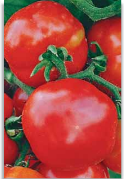
4485 Pomodoro Nano OR Patataro

Varietà di pomodoro molto rustica coltivata in alcune zone siccitose per la grande adattabilità a questo tipo di clima. Il frutto, di piccole dimensioni, tondo con il classico pizzetto, è particolarmente gustoso. La polpa, asciutta, fine e delicata, viene usata molto per le salse casalinghe. La pianta è semi-determinata, ma si coltiva generalmente a terra, senza sfemminatura.