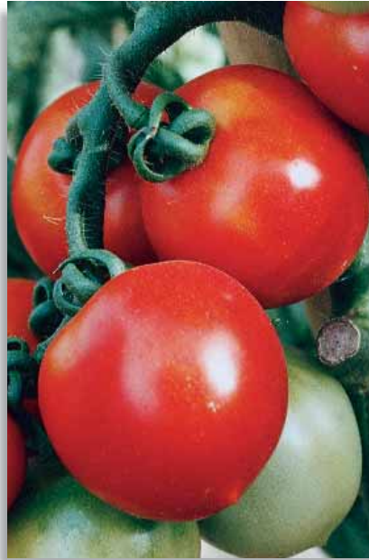
4453 Pomodoro Nano OR Pizzutello

Ibrido della tipologia Cherry con pianta determinata, molto compatta, vigorosa e sana, con internodi corti e con ottima copertura fogliare. A ciclo medio-precoce, presenta frutti tondi di piccole dimensioni (15g) a maturazione concentrata. Eccellente tenuta in campo e tollerante alle spaccature, adatto alla raccolta meccanica o manuale, anche a grappolo per il mercato fresco. IR:Tracheovorticilliosi; Tracheofusariosi.