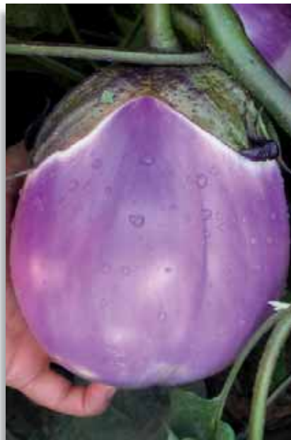
3655 Melanzana Lety F.1

Varietà della tipologia lunga, ottimamente adattabile a produzioni di serra e pieno campo. La pianta, di buona vigoria, ha portamento semi aperto, in modo da garantire una maggiore areazione ed una maggiore facilità di stacco dei frutti. Questi sono di colore nero, lucidi, di forma cilindrica, lunghi circa 25cm, dal calibro uniforme.