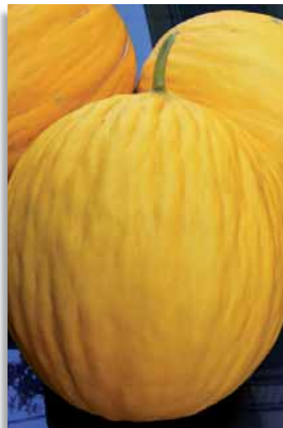
3741 Melone Meraviglia di Trapani F.1

Varietà di melone a buccia liscia, non solcata. La pianta è vigorosa, rustica, con produzioni scalari. Il ciclo di produzione è medio tardivo. Il frutto è tondo, di pezzatura medio grande. La polpa, di colore arancio carico, è di gusto aromatico ed ha Brix elevato. Adatto per colture di pieno campo e per piccolo tunnel.