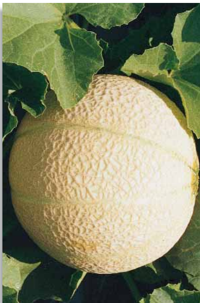
3850 Melone Sweetness F.1

Tipologia di melanzana di color bianco-crema, con la completa assenza di antociani. Polpa molto soda con pochi semi.