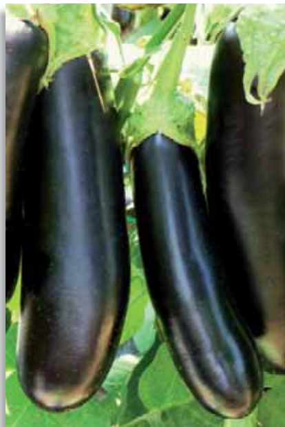
3681 Melanzana Moretta F.1

Varietà della tipologia lunga, ottimamente adattabile a produzioni di serra e pieno campo. La pianta, di buona vigoria, ha portamento semi aperto, in modo da garantire una maggiore areazione ed una maggiore facilità di stacco dei frutti. Questi sono di colore nero, lucidi, di forma cilindrica, lunghi circa 25cm, dal calibro uniforme.