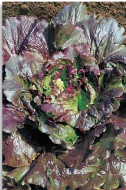
3570 Lattuga OR Rosplus

Batavia di grandi dimensioni, con foglie sfumate di rosso. Grazie alla sua rusticità è adatta per tutte le stagioni. Semina: tutto l'anno.