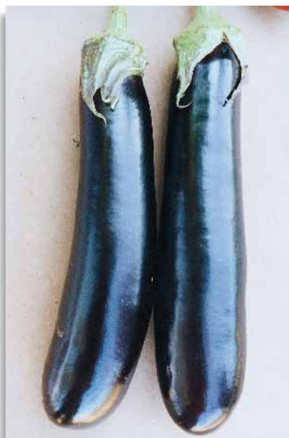
3630 Melanza Lunga 3

Pianta vigorosa, eretta, produce frutti lunghi 18-20cm con un diametro di 6-8cm, di colore nero, leggermente clavati. Il calice è verde, la polpa bianchissima, molto tenera anche a maturazione avanzata. La produzione raggiunge anche i 35 frutti/pianta.