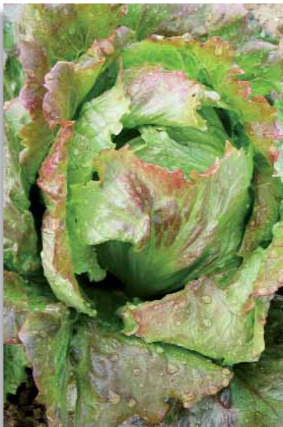
3515 Lattuga Meravilla De Verano Canasta

Batavia di grandi dimensioni, con foglie sfumate di rosso. Grazie alla sua rusticità è adatta per tutte le stagioni. Semina: tutto l'anno.