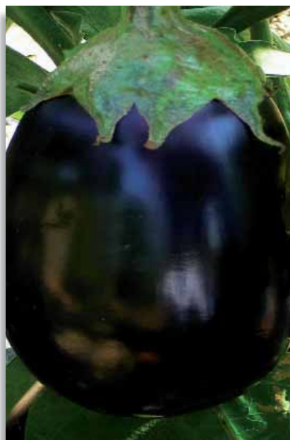
3620 Melanzana Bellezza Nera

Melanzana precoce a frutto molto grande, ovoidale irregolare, di colore viola scuro lucente e calice verde; la pianta è di medie dimensioni e presenta scarse spinosità. Tenera e molto gustosa.