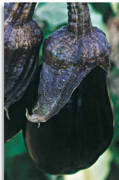
3690 Melanzana Durona

Tipica varietà di melanzana "a borsa" dal colore nero lucente persistente. La pianta produce molti frutti con polpa tenera e pochi semi. In alcune zone la tipologia viene chiamata "Baffa".