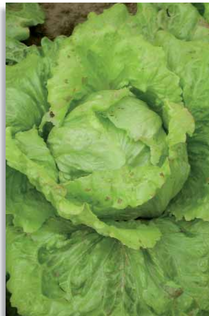
3279 Lattuga Unikum-AS

Varietà della tipologia canasta, lentissima a montare. Cespo voluminoso e pesante (800g), molto attraente, con fogliame spesso di colore rosso che si attenua nei periodi più caldi dell'anno. Adatta per tutti i cicli colturali dell'anno sia in serra che in pieno campo. Resistente ai più comuni ceppi di Bremia lactucae . HR: LMV.