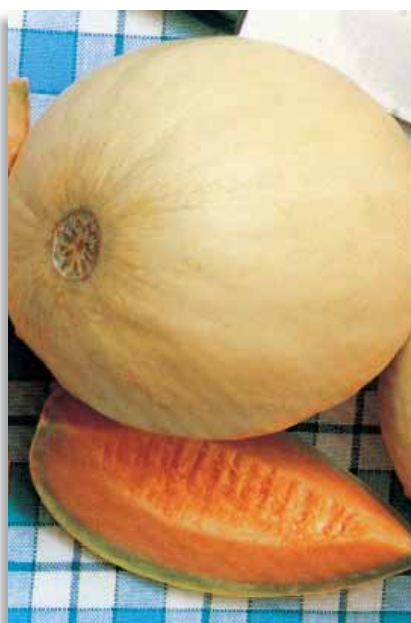
3720 Melone Summer Dream F.1

Varietà a polpa arancione e a retatura medio-fine, che segna leggermente la fetta, di ottimo gusto. I frutti sono abbondanti, rotondi, molto regolari nel peso (1Kg). Reggono bene ai lunghi trasporti ed hanno una buona tenuta dopo la raccolta. Per coltura in serra e pieno campo.