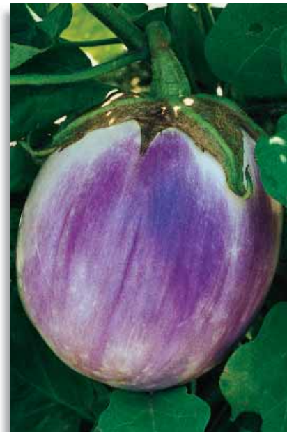
3640 Melanzana Rotonda Bianca Sfumata di Rosa

Particolare varietà di melanzana dalla caratteristica colorazione. Simile alla Sfumata di Rosa ma con colorazione più intensa, maggior precocità e produzione molto più elevata.