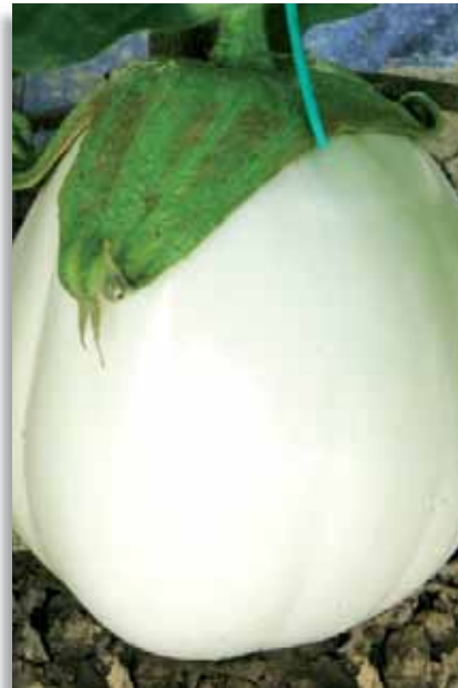
3625 Melanzana Bianca

Pianta di medie dimensioni che produce molti frutti con pochi semi e con calice poco spinoso. Apprezzata per il mercato fresco ed adatta per l'industria di trasformazione (in particolare per la grigliatura).