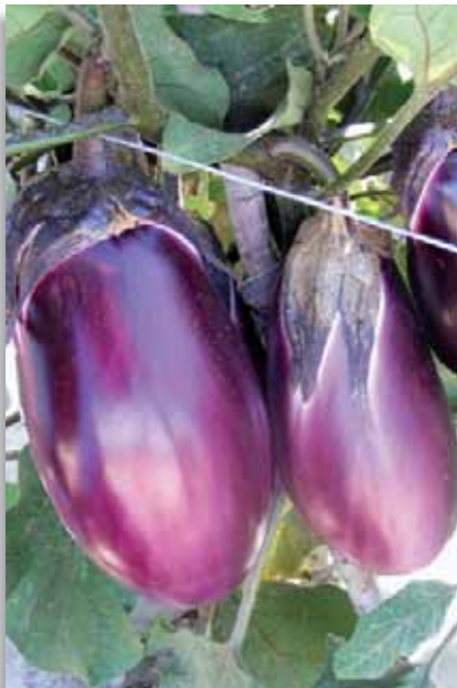
3652 Melanzana Seta F.1

Tipica melanzana di colore violaceo, di forma allungata, dalla polpa morbida e gustosa. Particolarmente apprezzata come tipologia locale.