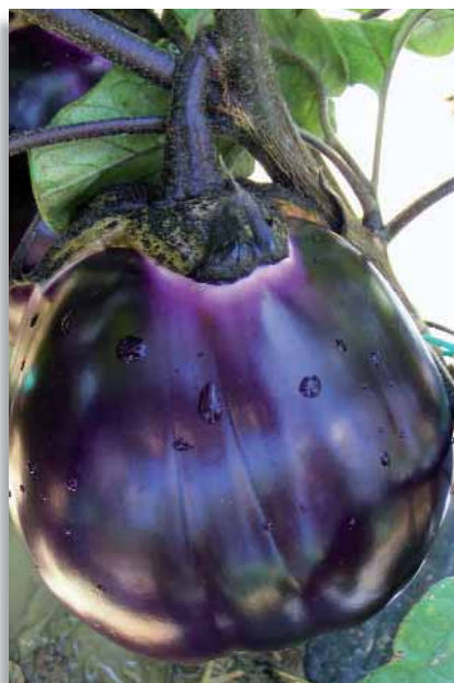
3650 Melanzana Violetta di Firenze

Melanzana molto apprezzata in Italia Centrale. I frutti sono grossi, rotondeggianti irregolari, pesanti, di colore bianco con leggere sfumature rosa.