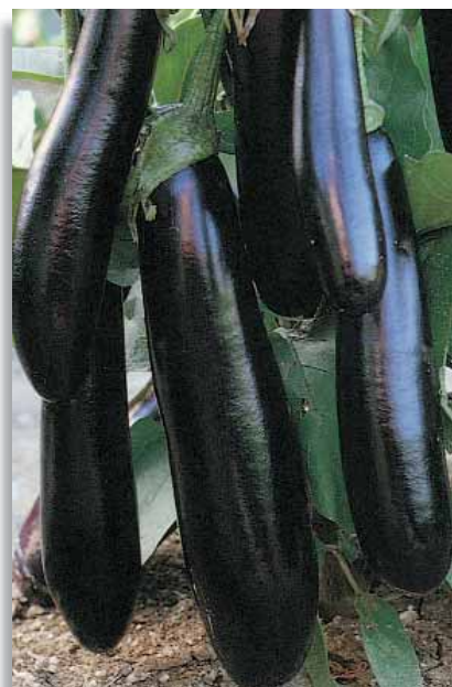
3680 Melanzana Morella F.1 (Cost. Enea-Convase)

Ottima selezione con frutto lungo a forma di clava. Colore viola scuro. Pianta robusta e resistente.