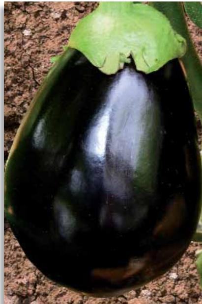
3677 Melanzana Black Top F.1

Tipica melanzana di colore violaceo, di forma allungata, dalla polpa morbida e gustosa. Particolarmente apprezzata come tipologia locale.